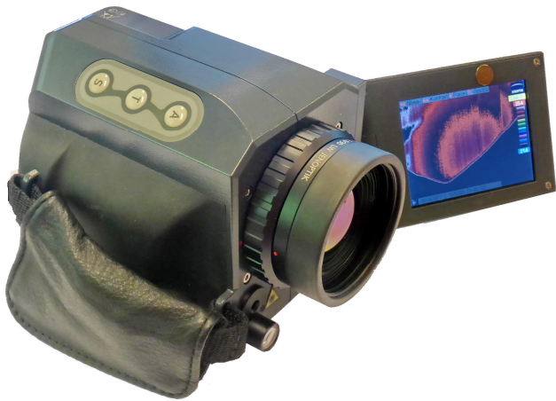
InfraTec VarioCAM inspect hr 675